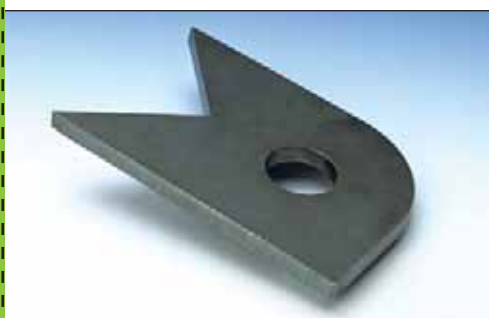
Pièce découpée avec le procédé DUALGAZ.