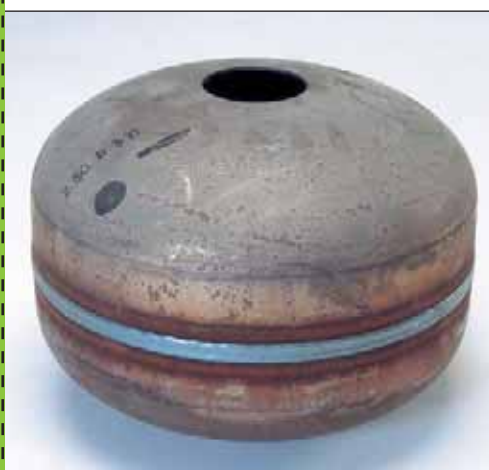
Bouteille de gaz soudée en TOPMAG.

Cette prestation QEOPS ESSAIS DE FAISABILITÉ vous offre la possibilité d'externaliser tout ou partie de vos études techniques en matière de coupage ou de soudage sur une nouvelle fabrication.