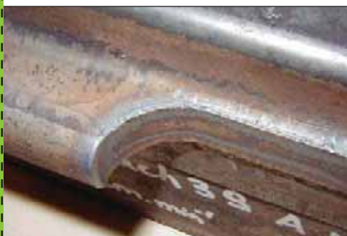
Oxycoupage de profil HEB.