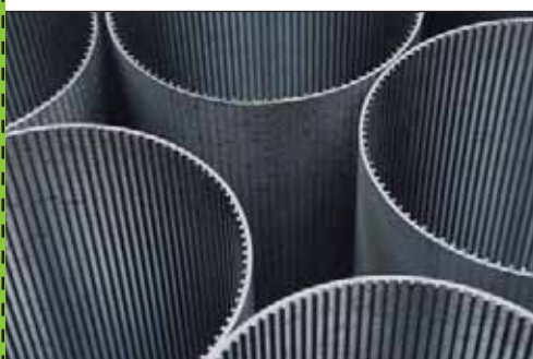
Filters à papier.