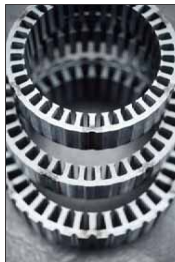
Soudage plasma déconfiné d'empilages magnétiques.